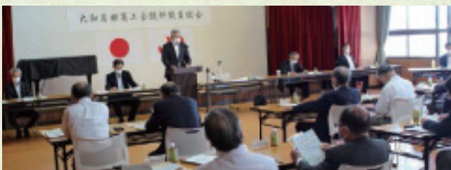
▲第152回通常議員総会 河村会頭挨拶