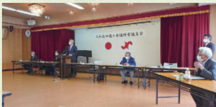
▲第215回常議員会河村会頭挨拶