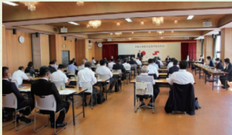
▲第152回 通常議員総会